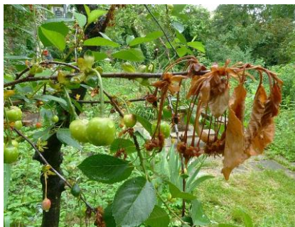
Monilia an Sauerkirsche

An frühblühenden Zierkirschen u.a. am Mandelbäumchen treten in diesem Jahr merklich Infektionen mit der Monilia-Spitzendürre auf. Leichter Nieselregen oder längere Tauphasen reichten bereits aus, damit die latent vorhandenen Pilzsporen über die offenen Blüten die Infektion setzen konnten.