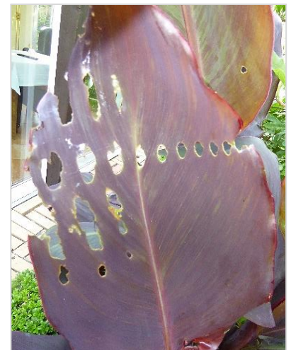
Von Schnecken geschädigtes Cannablatt