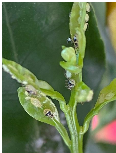
Blattlausbefall am Neutrieb von Zitrus

Sobald die überwinterten Kübelpflanzen im Freiland beginnen auszutreiben, sollte pflanzenartenspezifisch gezielt gedüngt und gewässert werden, um die in der Überwinterung entstandenen Defizite im Zuwachs und der Vitalität auszugleichen.