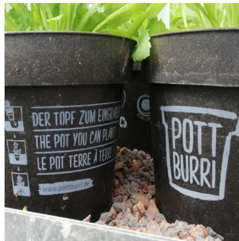
Beispiel für Kunststoffersatz: Töpfe aus Schalen der Sonnenblumenkerne zersetzen sich nach dem Einpflanzen oder können kompostiert werden.