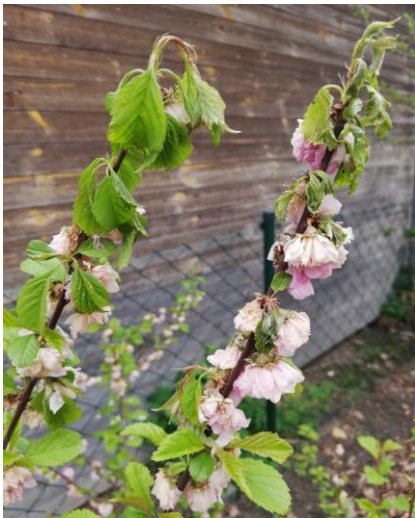
Spitzendürre an Mandelbäumchen - Frühstadium