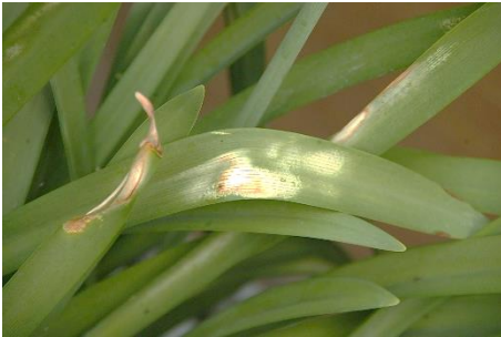
Agapanthusblatt mit Sonnenbrand

Die Witterungsbedingungen sind inzwischen so, dass einige nicht frostharte Pflanzen wie Oleander, Oliven, Rosmarin und Lorbeer, bestimmte Palmenarten wieder ins Freiland geräumt werden können. Da noch einige kalte Tage und Nächte zu erwarten sind, sollten aber kälteempfindlichere Arten bzw. welche mit weichem Austrieb wie Pelargonien, Fuchsien Bougainvillea noch an den geschützten bzw. schattigen Standorten verbleiben, um sich auch an die Freilandbedingungen anzupassen.