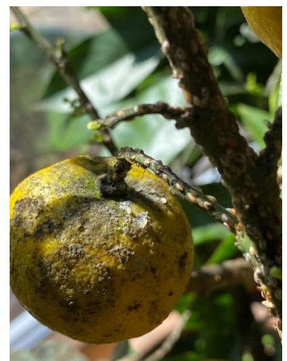
Verschmutzte Zitrusfrucht durch Ausscheidungen von Schildläusen