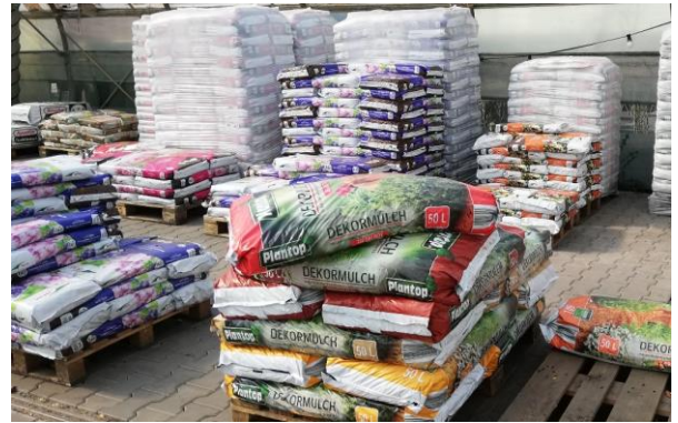
Substrate für jeden Verwendungszweck

Das Fertigerdentsortiment ist sehr umfangreich. Bei genauem Hinsehen zeigt sich aber, dass die vor allem preiswerten Erden einen hohen Torfanteil haben. Mit Ausnahme von Moorbeetpflanzen wie z. B. für Rhododendron, Eriken, Heidelbeeren kann aber auf diesen Bestandteil verzichtet werden. Wenn auch in Deutschland kein Torf mehr abgebaut wird, so gilt es, andersorts den Raubbau in den Mooren abzuwenden, um unwiederbringliche Ökosysteme zu schützen und noch höhere CO 2 Freisetzung zu verhindern.