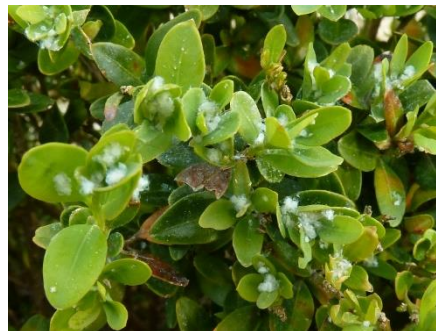
löffelförmige Blätter und Wachswolle durch Buchsbaumblattfloh