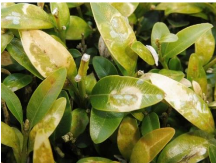
blasige Blattaufwölbungen durch Buchsbaumgallmücken

Buchsäume werden weiterhin von anderen Schädlingen geplagt: neben dem seit langen bekannten Buchsbaumblattfloh treten in trockenen Sommern vermehrt Spinnmilben auf und neuerdings verstärkt Gallmücken auf. Der Befallsdruck lässt dich durch Schnitt merklich senken.