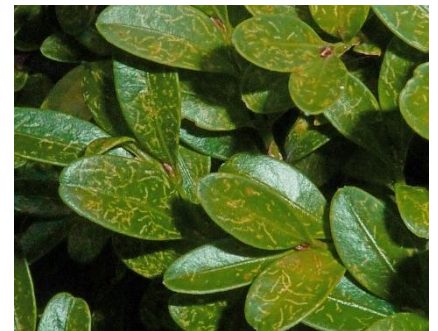
feine Saugschäden und Blattaufhellungen durch Spinnmilben