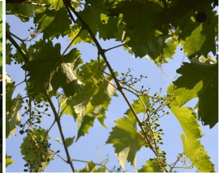
Optimale Schnittmaßnahmen mindern Pilzinfektionen während der Traubenbildung