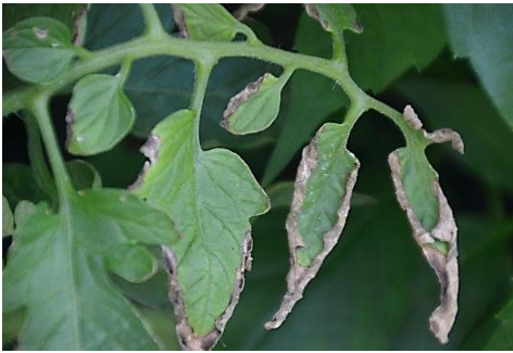
Blattrandnekrosen an Tomaten durch überhöhte Nährstoffgaben

Geplatze Früchte entstehen, wenn „Überkopf“ beregnet wird bzw. nach anhaltenden Niederschlagsereignissen. Früchte bleiben klein bzw. werden abgestoßen, wenn die Nährstoffe nicht mehr ausreichend sind.