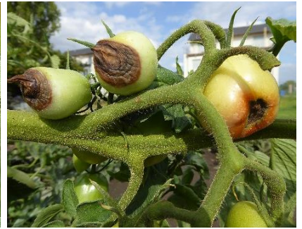
Blütenendfäule durch nicht optimale Nährstoff- und Wasserversorgung nach Hitzestau