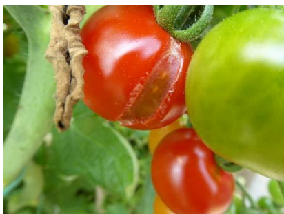
Geplatzte Tomatenfrüchte durch "Überkopfberegnung"

Das Wetter ist günstig, um reichlich gesunde Tomaten in den nächsten Wochen ernten zu können. Tomatenpflanzen benötigen für die gesunde Fruchtbildung ausreichend und regelmäßig Wasser und Nährstoffe.