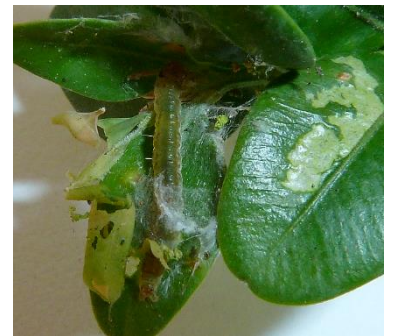
Schabefraß der Zünslerlarve

In den zur Flugüberwachung aufgehängten Fallen werden jetzt Buchsbaumzünsler gefangen. In den nächsten Tagen erfolgt die Eiablage, sodass die nächste Raupengeneration in der ersten Julihälfte schlüpfen wird. Zunächst verursachen sie Schabefraß an den Triebspitzen, später dann Kahlfraß bis auf die Mittelrippe. Absammeln, abspülen und die Hilfe von Singvögeln und Wespen nützen bei der Bekämpfung. Werden Behandlungen geplant, sind sie entsprechend zu terminieren. Umfassende Informationen finden Sie in unserem Merkblatt . Ab jetzt überlappen sich die Generationen, sodass auch noch große Larven und Puppen in den Beständen zu finden sind.