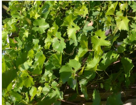
Starke Triebentwicklung am Wein