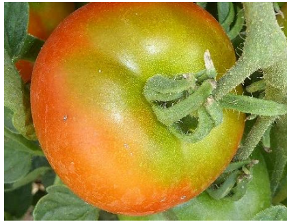
Grünkragen an Tomatenfrüchten durch suboptimale Bedingungen