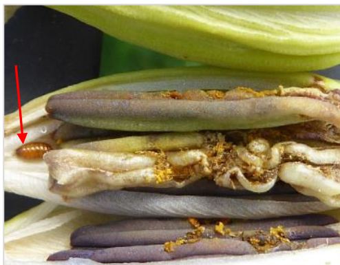
Geöffnete Lilienknospe nach Befall durch Lilienfliege, Tönnchenpuppe (links) überwintert im Boden

Bleiben Lilienknospen geschlossen und verfaulen, so können sie mit der Lilienfliege befallen sein. Deren Larven fressen in den Knospen bevorzugt an den Staubgefäßen. Öffnet man die Knospen, so sind gut die typischen Fliegenmaden und Tönnchenpuppen zu erkennen. Die Überwinterung erfolgt als Puppe in den oberen Bodenschichten. Die Befallsintensität ist sorten- und standortabhängig.