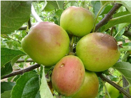
Starker Fruchtbehang an Apfelbäumen fördert Pilzinfektionen und damit Ernteverluste im Freizeitgarten

Auch die Weinreben haben sich in den letzten Wochen sehr gut entwickelt. Nach erfolgreicher Blüte sind die Fruchtsätze gut erkennbar. Weinreben neigen zu unterschiedlichen Krankheiten, die besonders von Feuchtigkeit und Wärme während der Beerenentwicklung begünstigt werden. Deshalb ist jetzt im Interesse einer gesunden Traubenentwicklung ein Schnitt durchzuführen. Die Triebe werden auf vier Blätter hinter dem letzten Fruchtsatz eingekürzt. Damit wird für die nächsten Wochen eine gute Durchlüftung des Bestandes gewährleistet.