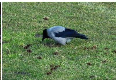
Krähe beim Verzehr (Räumung) von Engerlingen aus dem Rasen