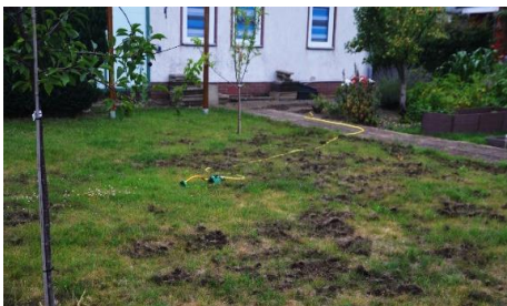
Mit Engerlingen befallene Rasenfläche nach der "Räumung" durch Vögel