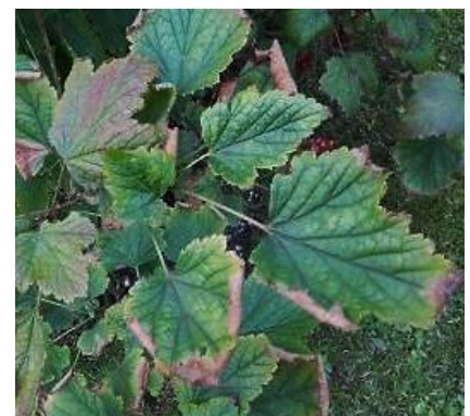
Kalimangel an schwarzer Johannisbeere mit typischen Blattrandnekrosen und nach oben aufgewölbten Blatträndern

Beerenobst – wie auch alle anderen Gartenpflanzen – sollte ausreichend mit Kali versorgt werden. Kali stärkt das Pflanzengewebe durch höheren Zelldruck, sodass die Pflanzen besser Trockenstress ertragen und Pilzkrankheiten abwehren können. Im Winter besteht eine höhere Frosthärte. Patentkali (Kalimagnesia) ist chloridarm und auch für empfindliche Kulturen wie (Beeren-)Obst, Rhododendron und Buchs geeignet.