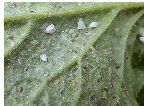
Von Schlupfwespen parasitierte Larven (dunkel ausgefärbt) der Mottenschildlaus

Am günstigsten ist es mechanisch vorzugehen. Adulte, Larven und Eigelege sind zu zerdrücken oder abzuwaschen. Wem dies zu aufwendig ist, kann die Zuwanderung durch Einsatz von Gemüsefliegennetzen minimiert werden. Die eingehausten Pflanzen dürfen aber noch keinen Befall aufweisen.