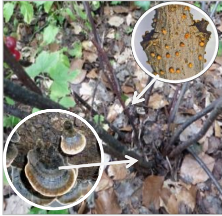
Johannisbeere mit Rotpustelbefall (Abb. oben) und Trameten (Abb. unten)