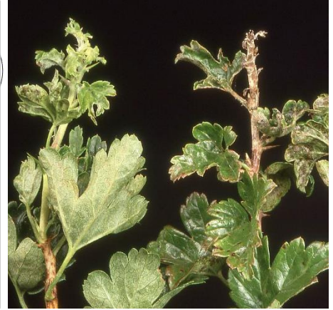
Blattdeformationen durch Amerikanischer Stachelbeermehltau

Jetzt ist der richtige Zeitpunkt, um durch gezielte Pflege die Sträucher auf die nächste Saison vorzubereiten.