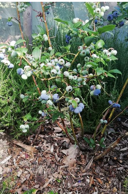
Heidelbeere mit Mulch

Beerenobst – wie auch alle anderen Gartenpflanzen – sollte ausreichend mit Kali versorgt werden. Kali stärkt das Pflanzengewebe durch höheren Zelldruck, sodass die Pflanzen besser Trockenstress ertragen und Pilzkrankheiten abwehren können. Im Winter besteht eine höhere Frosthärte. Patentkali (Kalimagnesia) ist chloridarm und auch für empfindliche Kulturen wie (Beeren-)Obst, Rhododendron und Buchs geeignet.