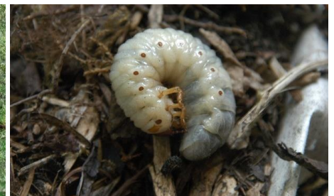
Engerling-Larve vom Juni- oder Gartenlaubkäfer unter der Rasennarbe

Innerhalb kurzer Zeit werden Rasenflächen besonders von Krähen umgewühlt. Die Vögel nutzen die für sie eiweißreiche Nahrung aus dem Rasen, die Engerlinge. Diese Rasen-Engerlinge sind die Larven vom Juni- oder Gartenlaubkäfer. In den letzten Wochen haben die Larven sich von den Rasenwurzeln ernährt, sodass auch auf bewässerten Rasenflächen gelbe Flecken entstanden.