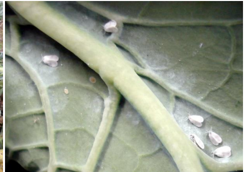
Adulte, Eier und Larven der Kohlmottenschildlaus blattunterseits am Kohl

Am günstigsten ist es mechanisch vorzugehen. Adulte, Larven und Eigelege sind zu zerdrücken oder abzuwaschen. Wem dies zu aufwendig ist, kann die Zuwanderung durch Einsatz von Gemüsefliegennetzen minimiert werden. Die eingehausten Pflanzen dürfen aber noch keinen Befall aufweisen.