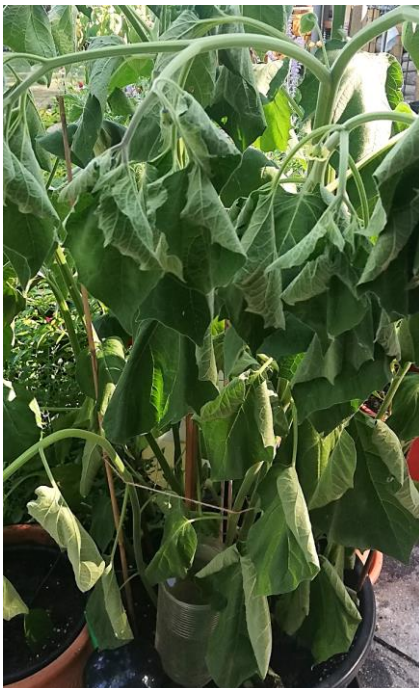
Andenbeere mit Hitzestress

Bewässerungsanlagen sind keine Universallösung, weil eine differenzierte Beregnung häufig nicht möglich ist. Ganz oft leiden immergrüne Hecken darunter: wind- und sonnenexponierte Abschnitte vertrocknen, Schattenbereiche ertrinken.