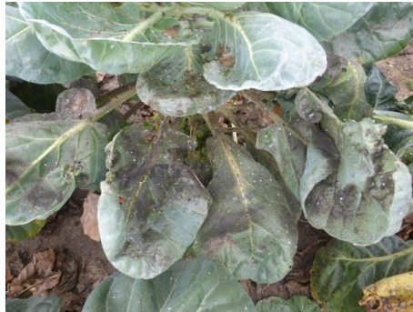
Rosenkohl verschmutzt durch die Ausscheidungen der Larven der Mottenschildlaus

In vielen Gärten sind Rosen- und Grünkohl in gutem Zustand. Aber jetzt beginnt die Mottenschildlaus die Kohlpflanzen zu besiedeln. Die weißen Fliegen wandern von Wildkräutern ein. Da bis zur Ernte noch einige Wochen vergehen, sollte jetzt die Populationsentwicklung unterbrochen werden, weil ein starker Befall die Pflanzen nicht nur schwächt, sondern durch den Honigtau stark verschmutzt.