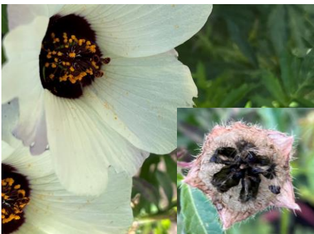
Stundenblume und Samenstand (rechts)