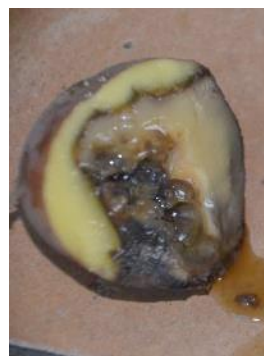
Bakterielle Nassfäule an Kartoffeln

Neben tierischen Schadorganismen sind von wesentlich größerer Bedeutung Knollenfäule und Knollenschorf durch Bakterien und Pilze. Treten diese Symptome auf, ist eine schnelle Selektion notwendig. Nassfaule Kartoffeln niemals kompostieren.