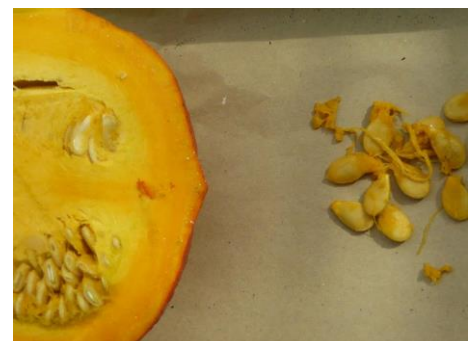
Kürbis mit freigelegten Samen zur weiteren Aufbereitung