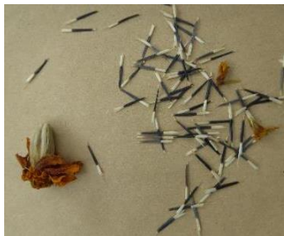
Samenstand und gesunder Samen von Studentenblumen