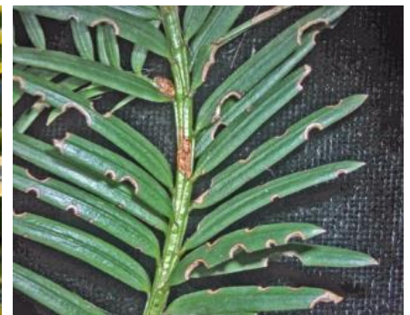
Fraßschäden an Pfingstrose, Spindelstrauch und Eibe

Eine bei richtiger Anwendung zuverlässige Bekämpfungsmöglichkeit ist seit Jahren der Einsatz von Nematoden ( Heterorhabditis bacteriophora und Steinernema carpocapsae ) gegen den Gefurchten Dickmaulrüssler. Diese Fadenwürmer werden im Gießverfahren ausgebracht, sie dringen im Boden in die Dickmaulrüsslerlarven ein und bringen sie zum Absterben. Befallene Larven werden braun. Verwandte Dickmaulrüssler-Arten können mit Heterorhabditis downesi gut bekämpft werden. Die Nematoden sind für Menschen und Haustiere völlig ungefährlich.