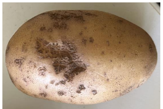
Schorf an Kartoffelknolle

Weitere Informationen finden Sie in unseren Merkblättern zu Schaderregern und Schadursachen sowie in den online-Handbüchern "Berliner Pflanzen – Gehölze und Stauden im Garten" und "Berliner Pflanzen – Obstanbau im Garten".