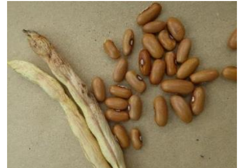
Bohnenhülse mit Saatgut

Wertvolle sortenspezifische Hinweise können Sie bei Heistering, A. u.a. (2010): Handbuch der Samengärtnerei, Ulmer-Verlag, nachlesen.