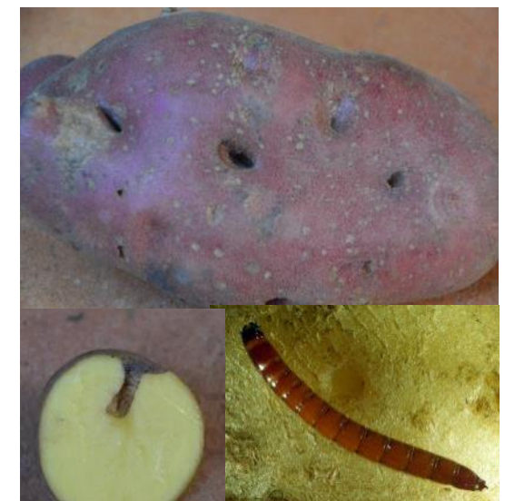
Drahtwurmbefall an Kartoffelknolle (oben und links); untern rechts: Drahtwurm-Larve vom Schnellkäfer