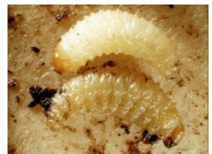
Oben gesunde, unten von Nematoden befallene Larve

Eine Bestellung der Nützlinge ist im Fachhandel oder im Internet für Flächen zwischen 20 und 1000 m 2 möglich. Umgehend nach Erhalt sollten die Nematoden ausgebracht werden: dafür werden sie in Wasser gegeben und unter häufigem Umrühren mit der Gießkanne gegossen. Der Boden muss ohne Staunässe in den nächsten Wochen feucht bleiben. Die Ausbringung sollte bei bedecktem Himmel erfolgen. Danach die Flächen wässern, um an Pflanzen anhaftende Nematoden in den Boden zu spülen.