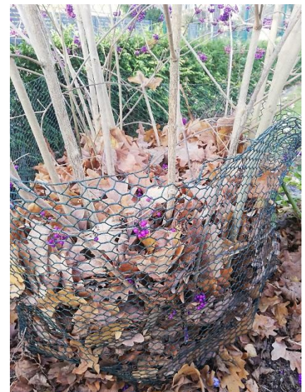
Laubschutz für Callicarpa im Ring aus Kaninchendraht

Rosen benötigen speziellen Winterschutz. Wenn die Temperaturen dauerhaft niedrig bleiben, werden sie locker mit Gartenerde angehäufelt, besser mit reifem Kompost. Damit sich das Material gut verteilen lässt, können die Triebe eingekürzt werden. Der eigentliche Rückschnitt erfolgt erst im Frühjahr. Besonders frisch gepflanzte Rosen sollten zusätzlich mit Nadelholzreisig eingedeckt werden. Kletterrosen erhalten in sonnenexponierter Lage zusätzlichen Schutz durch Schattierung mit Reisig oder Schattenleinen. Die Kronen von Rosenstämmchen werden mit Tannenreisig eingebunden und zur Fixierung mit Jutesäcken umhüllt. Der Stamm und besonders die empfindliche Veredlungsstelle werden mit Reisig und Strohmatte ebenfalls vor Sonne und Austrocknung bewahrt.