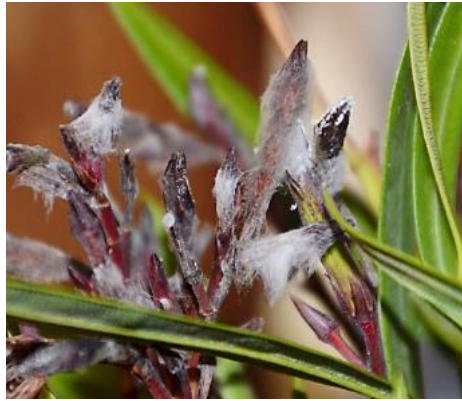
Oleanderknospe besiedelt mit Grauschimmelpilz muss während der Überwinterung entfernt werden

Auch tierische Schädlinge überwintern mit den Kübelpflanzen gemeinsam. Besonders Spinnmilben, Pflanzenläuse aller Art, Schnecken können unter passenden Bedingungen Problemfall im Winterquartier hervorrufen. So sollte aller Sekundärbewuchs in den Kübeln wie z.B. Unkräuter eliminiert werden, nicht selten leben bekannte Schadorganismen darauf. Auch Schnecken und Pilzfruchtkörper sind abzusammeln - auch vom Kübelboden.