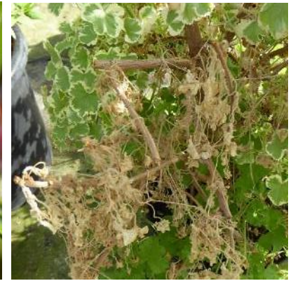
Trockene Triebe – Potential für Krankheitserreger