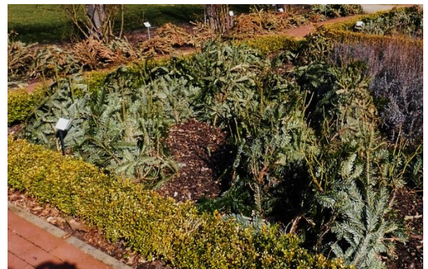
Rosenbeet mit Winterschutz

Bevor Winterschutz dauerhaft angebracht wird, ist erkranktes Fall-/ Laub zu entfernen, besonders wichtig bei Rosen wegen der mit Sporen überdauernden Pilzkrankungen (Rost, Sternrußtau).