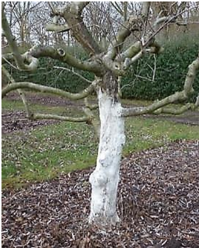
Weißanstrich am Apfel

Nur frostempfindliche Stauden wie z.B. Artischocken, Freilandgloxinien, Steppenkerze und Staudenbleiwurz werden mit Laub und Reisig geschützt. Ziergräser brauchen keinen zusätzlichen Schutz, wenn man sie erst im Frühjahr zurückschneidet. Der dichte Horst schützt vor Kälte. Eine Ausnahme bildet das Pampasgras , das in Südamerika beheimatet ist. Nicht so sehr die Kälte, dafür aber die Nässe im Winter schädigt. Es wird hochgebunden und Reisig schräg angestellt, um es vor Nässe im Inneren zu schützen.