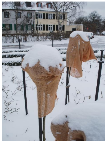
und an Rosenstämmchen