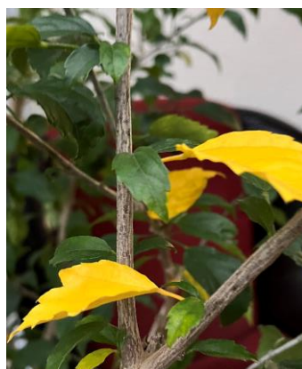
Gelbe Blätter zeigen Licht- oder Nährstoffmangel auf

Einige Blätter haben einen klebrigen schwarzen Pilzüberzug. Dabei handelt es sich um Ausscheidungen von saugenden Insekten (Honigtau), der in Folge von Rußtaupilzen besiedelt wird. Die Ursachen müssen dringend beseitigt werden, meist handelt es sich um starken Schild- oder Blattlausbefall.