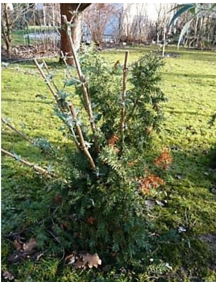
Winterschutz an Sommerflieder

Empfindliche Gehölze wie Sommerflieder ( Buddleja ), Bartblume ( Caryopteris ), Blauraute ( Perovskia ), Gartenhibiskus, jüngere Gartenhortensien, Schönfrucht ( Callicarpa ) oder Säckelblume ( Ceanothus ) werden ca. 40 cm hoch mit Laub „eingepackt.“ Nicht das Laub selbst, sondern die Luft zwischen den Blättern isoliert gegen Kälte. Daher trockenes Laub locker verwenden. Schräg angelehntes/gestecktes Tannenreisig oder ein Ring aus Kaninchendraht dienen der Fixierung. Auch für Wein und Kiwi ist in den ersten Standjahren ein Reisischutz bis in ein Meter Höhe empfehlenswert.