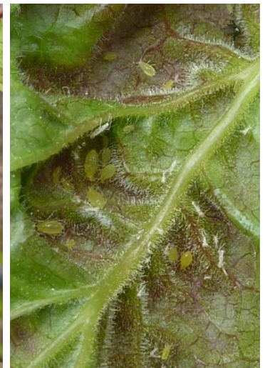
Blasenläuse auf Blattunterseite

An Johannisbeerblättern sind jetzt die ersten Befallssymptome der Johannisbeerblasenlaus erkennbar. Der toxische Speichel der einzeln auf der Blattunterseite sitzenden hellgrünen Blattläuse verursacht anfangs rote Flecken an roten Johannisbeeren und gelbliche Flecken an weißen und schwarzen Johannisbeeren. Später wölben sich die jungen Blätter auf. Die Sträucher werden aber dadurch nicht nachhaltig geschädigt.