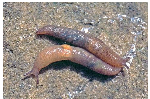
Ackerschnecken 3 bis 4 cm lang