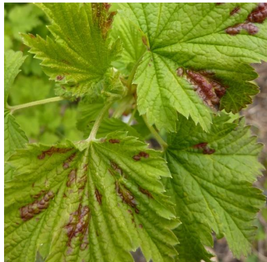
beginnender Befall mit Johannisbeerblasenlaus