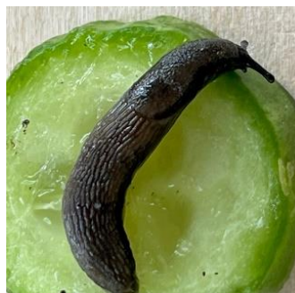
Garten-Wegschnecke - schwarz mit gelber Sohle, bis 4 cm lang