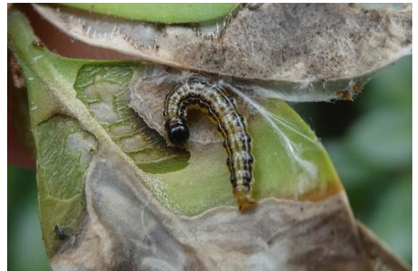
Aktuell fressende Larve des Buchsbaumzünslers

Das Schnittgut sollte zeitnah und vollständig aufgenommen und entsorgt werden, damit die Junglarven keine Chance haben, wieder in den Buchsbaum einzuwandern. In den nächsten Wochen sollte der Buchsbaum regelmäßig auf weiteren Raupenfraß kontrolliert werden. Ein Absammeln ist dann chemischen Maßnahmen vorzuziehen.