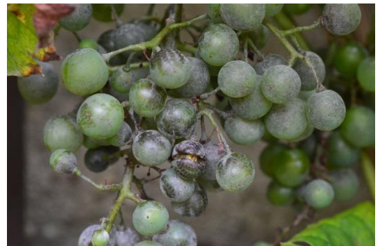
Echter Rebenmehltau, erkennbar am grauen Belag und aufgeplatzten Früchten

Echter Mehltau verursachte in den letzten Jahren die meisten Verluste an den Reben. Der Echte Mehltau ist auf Weinreben spezialisiert. Er überwintert an den Triebaugen und am Rebholz, erkennbar an dunklen Flecken („Oidium-figuren“). Mit zunehmender Temperatur und höherer Luftfeuchtigkeit werden Jungtriebe und Blütenstände schnell infiziert.