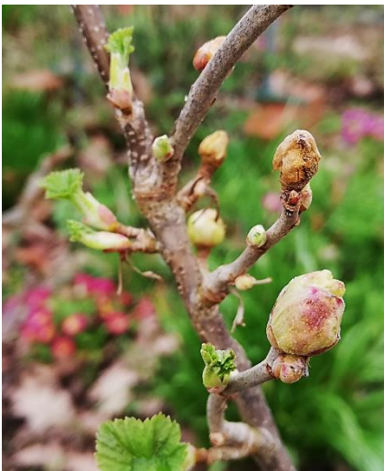
Rundknospen an Schwarzer Johannisbeere

Rundknospen sollten jetzt konsequent ausgebrochen und entsorgt werden. Neupflanzungen nicht in die Nähe befallener Sträucher setzen, weniger anfällige Sorten bevorzugen.