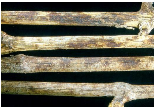
Echter Rebenmehltau - dunkle Flecken am Rebholz aus abgestorbenem Pilzmyzel – „Oidium-Figuren“

Grauschimmel überdauert an Mumien und Trieben. Feuchte Witterungsbedingungen begünstigen bereits schädigenden Befall an jungen Trieben und Blütenständen und verstärken sich in der Saison bei feuchtem Wetter.