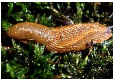
Jungtier der Spanischen Wegschnecke

Weitere Hinweise unter: Tierische Schaderreger - Berlin.de