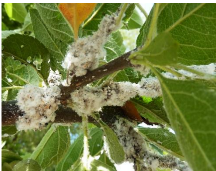
Wachswolle im Apfelbaum

Der Saftentzug beim Saugen schadet kaum, aber der toxische Speichel bewirkt knollige Rindenschwellerungen, den sogenannten Blutlauskrebs. Aufgeplatzte Wunden ermöglichen das Eindringen pathogener Pilze. Junge befallene Triebe reifen schlecht aus, sind frostempfindlicher und können bei starkem Befall eintrocknen. Blutläuse können bis zu 10 Generationen bilden und überdauern den Winter ohne Wachswolle in Rindenspalten und im oberen Wurzelbereich. Besonders anfällige Sorten sind 'Cox Orange', 'Goldparmäne', 'Landsberger', 'Klarapfel', 'Jonathan', 'James Grieve'.