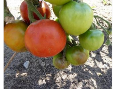
Durch Kraut- und Braunfäule befallene Tomaten