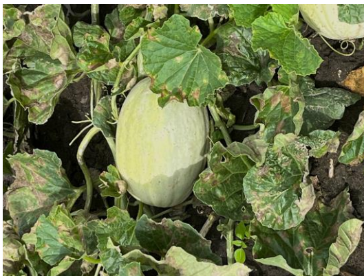
Aktueller Blattverlust an Melonen durch Falschen Mehltau

Die feuchte Witterungslage hat dazu geführt, dass sich jetzt die Problemkrankheit der Kartoffeln und Tomaten, die Kraut- und Braunfäule, und an Gurke und Melone, der Falsche Mehltau, sehr schnell ausbreiten werden und den Ertrag in Frage stellen. Die Infektions- und Ausbreitungsbedingungen sind jetzt sehr günstig.