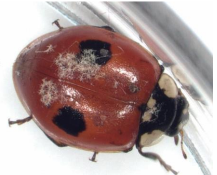
Pilzmyzel auf dem Schild