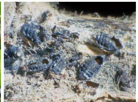
parasitierte Blutläuse mit Ausschlußlöchern der Zehrwespen

Befallene Jungtriebe sind im Rahmen des Sommerschnittes zu entfernen. Kolonien an Stamm- und Astwunden kann man mit einer Bürste und Schmierseifenlösung beseitigen.