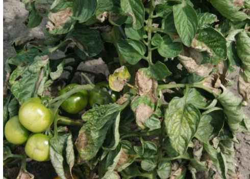
Erste Symptome durch Kraut- und Braunfäule an Tomaten