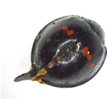
Marienkäfer mit Rissen