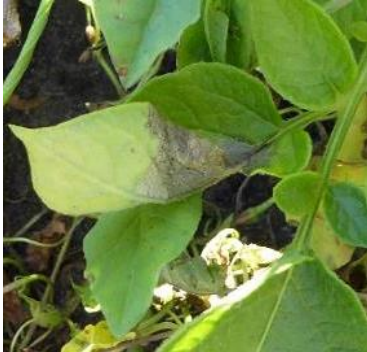
Schwarzbraune wässrige Flecken an Kartoffellaub durch Kraut- und Braunfäule – Laub entfernen!