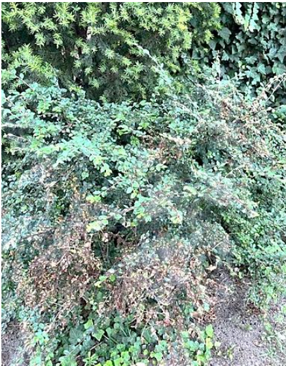
Cotoneaster-Strauch eingesponnen und abgefressen durch Larven der Weißdornmotte

Zwergmispeln ( Cotoneaster ), die von sehr feinen, dünnen Gespinsten überzogen sind, sind von der Weißdornmotte befallen. Die langen, schlanken Larven (15 mm) sind gelborange bis rotbraun mit weißer Behaarung. Sie fressen gesellig in den Gespinsten und produzieren dabei große Kotmengungen.