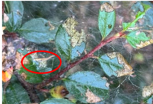
Schabefraß der Weißdornmottenlarven an der Zwergmispel

Zwergmispeln ( Cotoneaster ), die von sehr feinen, dünnen Gespinsten überzogen sind, sind von der Weißdornmotte befallen. Die langen, schlanken Larven (15 mm) sind gelborange bis rotbraun mit weißer Behaarung. Sie fressen gesellig in den Gespinsten und produzieren dabei große Kotmengungen.