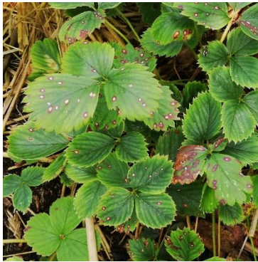
Weißfleckenkrankheit - vor dem Ausputzen...

Altes Gärtnerwissen besagt, dass Erdbeeren maximal zweijährig angebaut werden sollten. Diese Vorgehensweise ist durchaus berechtigt. Dadurch wird verhindert, dass sich über die Jahre bodenbürtige Pilze, wie z.B. die Rhizom- und Lederbeerenfäule, etablieren. Sicheres Erkennungszeichen sind trotz Bodenfeuchte welke Blätter. Halbreife Früchte vertrocknen und schmecken bitter. Wird der Wurzelansatz angeschnitten, ist eine braune Verfärbung erkennbar. Befallene Pflanzen sind sofort über den Müll zu entsorgen.