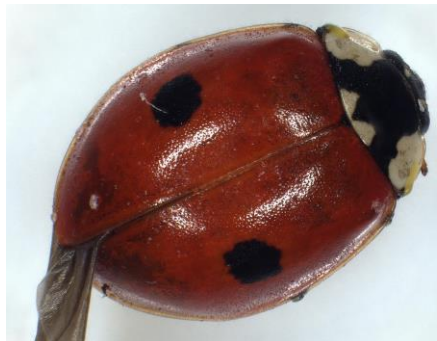
Marienkäfer mit Milbenbefall am Hinterteil, deformierter Flügel