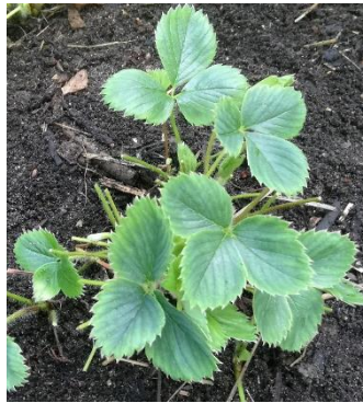
... und danach

Regenreiches Wetter fördert den Befall mit Grauschimmel ( Botrytis ). Um eine gute Durchlüftung und damit das Abtrocknen des Bestandes zu verbessern, sollte jetzt das Laub bis auf wenige junge und gesunde Blätter entfernt werden. Gleichzeitig wird damit auch der Befallsdruck durch die Weißfleckenkrankheit reduziert.