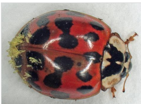
Asiatischer Marienkäfer mit Pilzbefall am Hinterteil

Häufiger konnten in den letzten Wochen deformierte und geschädigte heimische Marienkäfer gefunden werden.