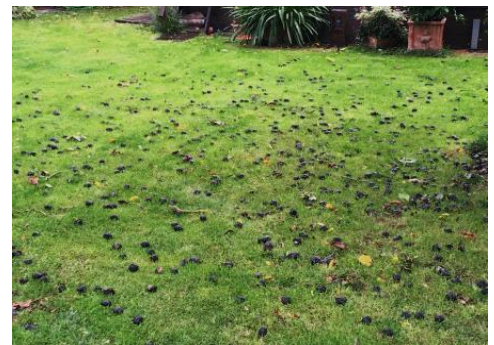
Schwarze Nüsse auf dem Rasen fördern Rasenpathogene