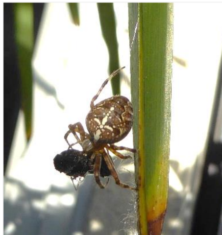
Gartenkreuzspinne mit Beute