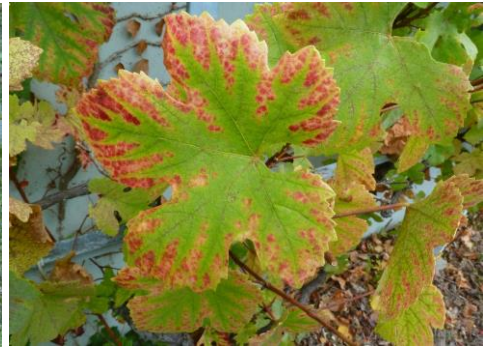
Kaliummangel an Wein

So zeigen sich Mangelerscheinungen an Rosen, Stauden, Beerenobst und vielen Gehölzen, vor allem Rhododendron. Stickstoffbetonte Dünger sollten jetzt nicht mehr gegeben werden, weil sie einen Wachstumsschub bewirken würden und die Pflanzen bis zum Winter nicht mehr rechtzeitig abschließen und aushärten könnten.