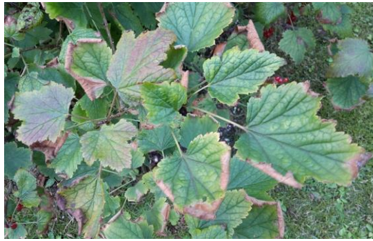
Kaliummangel an Johannisbeere

Häufiges Wässern und ergiebige Niederschläge in der letzten Zeit haben dazu geführt, dass wichtige Nährstoffe wie z.B. Stickstoff und Kalium ausgewaschen worden sind und damit den Pflanzen nicht zur Verfügung stehen.