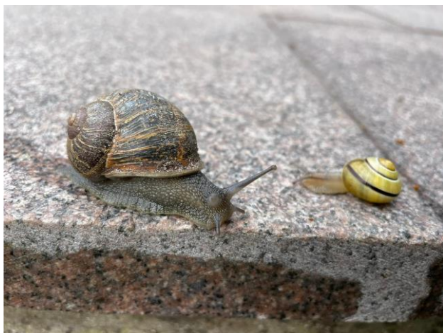
links: Gefleckte Weinbergschnecke, rechts: Gartenbänderschnecke