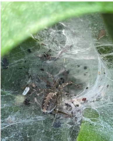
Labyrinthspinne am Netz mit Nahrungsresten