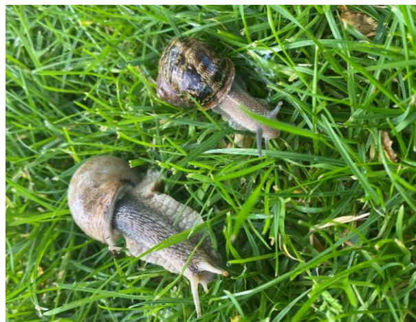
oben: Gefleckte Weinbergschnecke, unten: Große Weinbergschnecke

Ursprünglich im mediterranen Raum beheimatet, hat sich die Gefleckte Weinbergschnecke ( Cornu aspersum ) seit Jahren in Westeuropa und den küstennahen Gebieten Großbritanniens ausgebreitet. Sie ist ausgewachsen etwas kleiner als die bekannte Große Weinbergschnecke. Ihr helles Gehäuse hat charakteristische dunkle Bänder mit hellen Linien und eine sehr raue Schale.