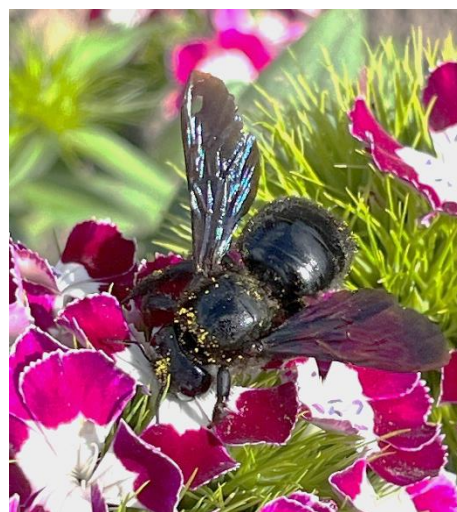
Blauschwarze Holzbiene auf einer Nelkenblüte

Ursprünglich in Südeuropa beheimatet tritt sie seit rund 10 Jahren zunehmend in Berlin auf. Für die Fortpflanzung benötigt sie älteres, sonnenbeschienenes Totholz von Obstbäumen, Pappeln und Weiden, in das sie ihre Brutgänge nagt. Sie überwintert als Insekt in geschützten Hohlräumen wie Mauerspaltten oder Holzgängen. Sie ist völlig friedlich, greift auch in Nestnähe nicht an.