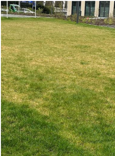
Rasen mit Nährstoffmangel

Der Rasen ist aufgrund der Witterungsverhältnisse überall in einem guten bis befriedigenden Zustand.