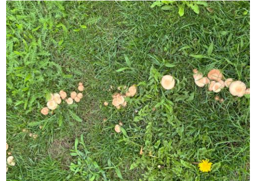
Staudenungräser, Hirse und Pilzfruchtkörper im Rasen jetzt entfernen

Auch Falllaub, Früchte, Nüsse, Kastanien etc. müssen regelmäßig im Herbst abgeharkt werden, damit der Rasen zur Pilzprophylaxe gut abtrocknen kann und eine angemessene Lichtversorgung auch während der lichtarmen Jahreszeit für die Photosynthese gewährleistet wird. Fäulnisprozesse an faulem Obst und Nüssen können sehr schnell auf die Rasenpflanzen übergehen und sie schädigen. Auch die Fruchtkörper von sehr unterschiedlichen Pilzarten sind zu entfernen, um deren unkontrollierte Ausbreitung zu verhindern