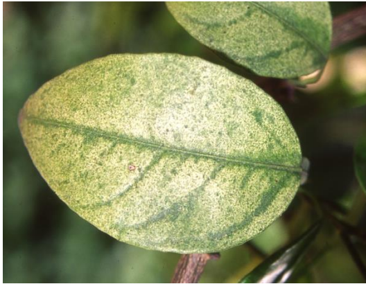
Zitrusblatt geschädigt durch Spinnmilben

Unter den tierischen Schädlingen spielen in diesem Jahr besonders Spinnmilben eine Rolle. Oleander, Zitruspflanzen, Frangipani u.a. sollten kontrolliert werden. Bei starkem Befall ist eine Behandlung mit einem akariziden Wirkstoff sinnvoll, um einer weiteren Ausbreitung entgegen zu wirken.