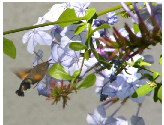
Taubenschwänzchen (links) an blühender Kübelpflanze im Herbst

Nicht nur die Verwendung des Gemüses macht die Ernte im Garten vielfältiger, sondern unterstützt im Spätsommer, wenn andere Blüten für die Ernährung von Insekten bereits rar sind, die Versorgung dieser Tiergruppen. Unterstützt wird dies noch durch einen späten Blattlausbefall, der räuberische Insekten zusätzlich anlockt.