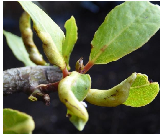
Deformierte chlorotische Blätter nach Befall durch den Lorbeerblattfloh

An einigen Orten konnte der Lorbeerblattfloh festgestellt werden, bei geringem Befall reicht vor der Überwinterung ein Ausschneiden der Befallsstellen aus.