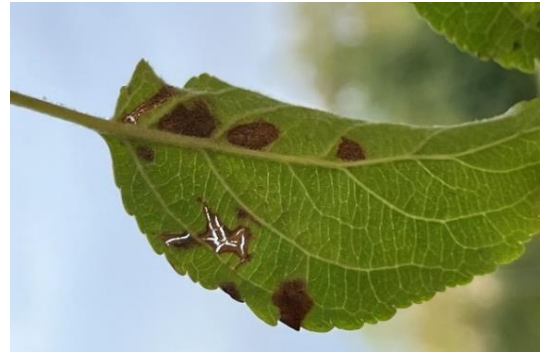
Apfelblatt mit Schorfinfektion im Herbst

Heute möchten wir Ihnen die Beispiele zur Überwinterung von Schadorganismen am/im Laub vorstellen, um klar