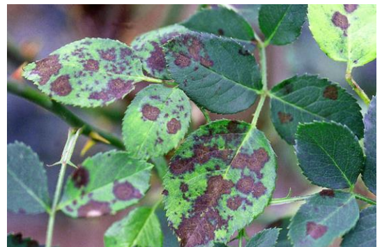
Sternrußtau an Rosen überdauert am Blatt für eine Neuinfektion im kommenden Jahr