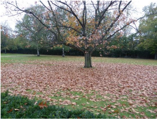
Laubfall im Herbst

zu machen, dass das Verbleiben oder Entfernen von Laub aus dem Garten spezifisch betrachtet werden muss.