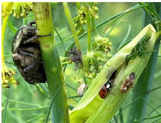
Rosenkäfer, Marienkäfer, Wanzen an blühendem Knollenfenchel im Herbst

Knollenfenchel, Artischocken, Auberginen, Paprika- und Chilisor-ten finden immer mehr Platz in den Gärten, weil sie aufgrund der Temperaturerhöhung und der damit einhergehenden Saisonverlängerung auch im Freiland ertragsbildend wachsen.